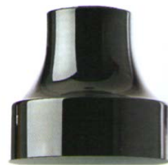
Lampada a sospensione Lady, Fabbian.