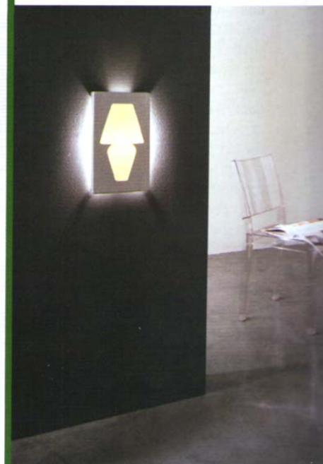
Lampada Abat-Jour, Fabbian.

Se sei indeciso su che strada prendere, prendi sempre la più difficile.