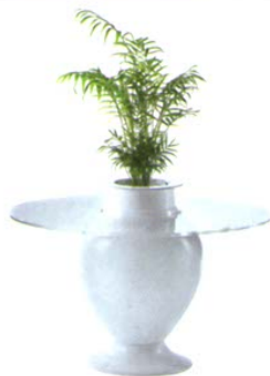
Tavolino Vasolo, Crestani Ceramiche.