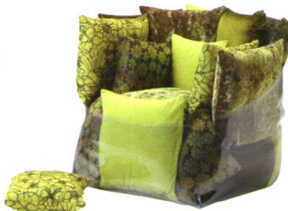
Poltrona Soufflé, Coin Casa.